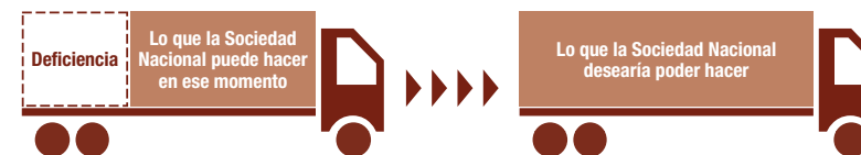
Gráfico 6. Deficiencias en la preparación para la elaboración de programas de transferencias de dinero en efectivo que deberían subsanarse mediante el plan de acción.

En las siguientes fases subsidiarias se aborda esta distinción, sobre la base de los escenarios elaborados en el paso 2. Las siguientes fases subsidiarias incluyen dos procesos participativos: uno para crear conciencia y otro para trabajar en los detalles. En algunos casos pueden combinarse. Tal vez sea necesario comenzar con la fase subsidiaria 3.3.