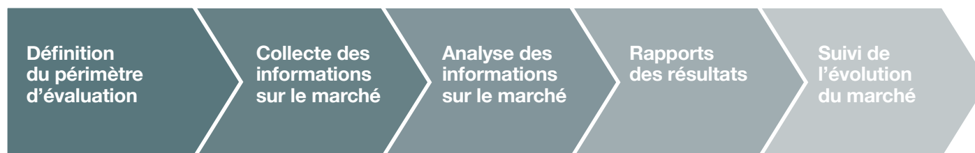
Figure 1 : Le processus ERM

Les instructions suivantes sont organisées en cinq étapes pour l'ERM : i) Définition du périmètre d'évaluation, ii) collecte des informations sur le marché, iii) analyse des informations sur le marché, iv) rapports des résultats et v) suivi de l'évolution du marché.