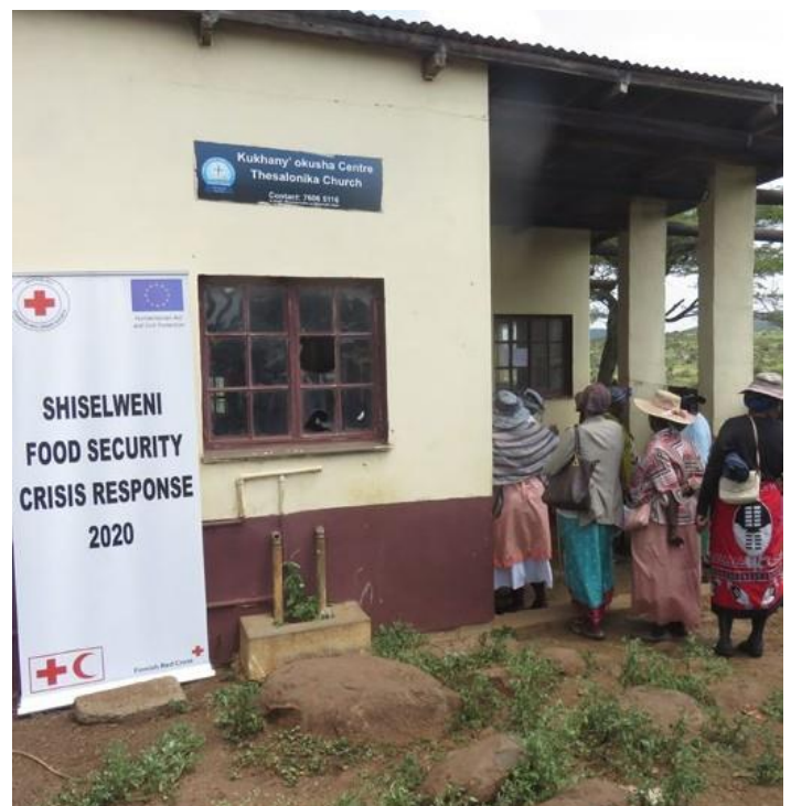
Реакция BERCS на кризис в сфере продовольственной безопасности в Шизельвени

Данные мониторинга после выплаты денежных средств, опубликованные в сентябре 2020 года, показали, что в подавляющем большинстве случаев отзывы о программе были положительными. 91,4 % получателей помощи были удовлетворены выдачей наличных денег, и большая часть этих денег была использована для приобретения продуктов питания. Полученные в ходе этого процесса данные продемонстрировали необходимость контроля цен и повышения уровня ответственности рыночных торговцев во избежание спекуляций и потенциального роста цен, а также необходимость адаптировать систему финансовой помощи для оказания поддержки многодетным семьям. Несмотря на наличие вопросов, требующих совершенствования процесса, ответные меры свидетельствовали о том, что в Эсватини имеется потенциал и готовность быстро оказывать денежную помощь в необходимых масштабах.