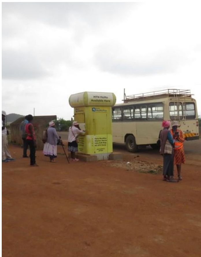
Получатели мобильных денег в Матсанджени стоят в очереди, чтобы обналичить средства.

Эти проблемы вызвали потребность в новом подходе к предоставлению государственной помощи в требуемом масштабе. Правительство решило рассмотреть более инновационный подход, который внедрялся BERCS с 2016 года, и изучить варианты реализации мер реагирования путем денежно-ваучерной помощи.