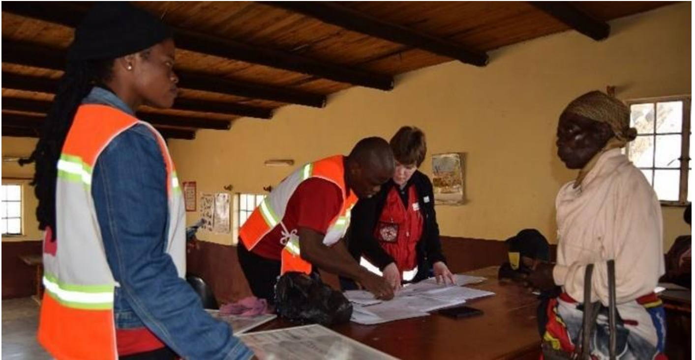
Волонтеры BERCS в пункте регистрации во время выдачи наличных денег в Сомнтонго.

В настоящее время в Эсватини существует ряд проблем, ограничивающих функционирование механизмов СП, нацеленных на удовлетворение потребностей, эффективное распределение средств, меры реагирования после каких-либо масштабных потрясений и в конечном итоге на борьбу с нищетой.