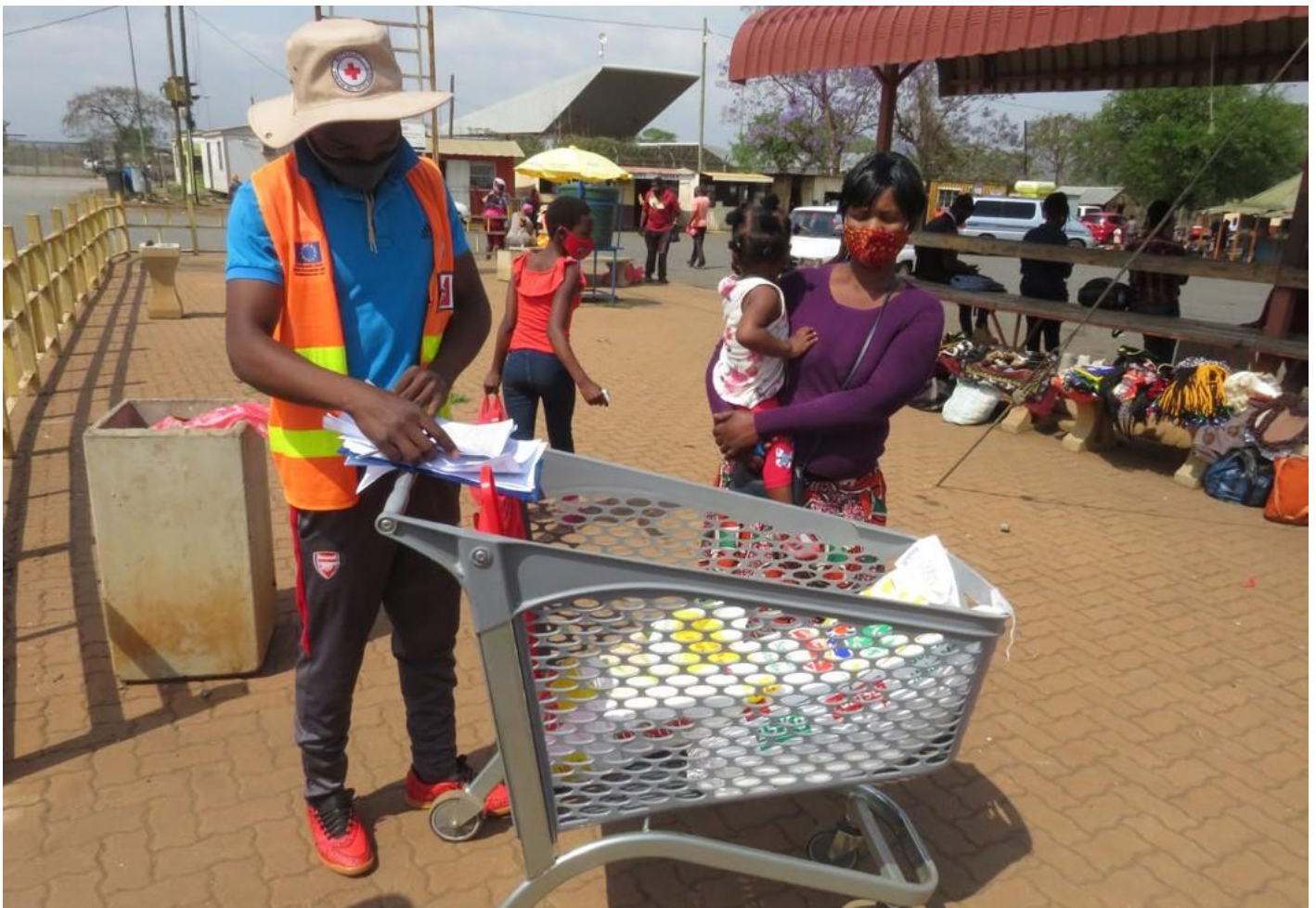
После обналичивания в результате получения помощи от BERCS в размере E700, получатели могут приобрести кукурузную муку, рис, бобы, овощи и многие другие продукты питания. Источник: BERCS, 2020 г.