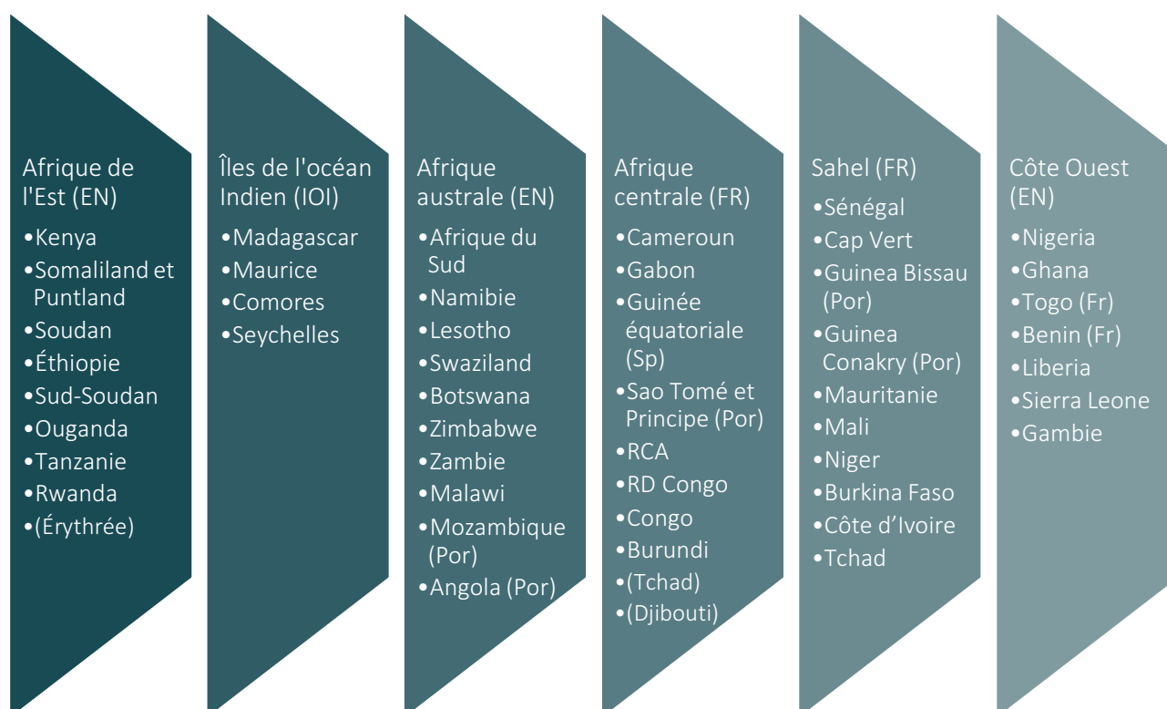
Figure 3: Aperçu de la structure de la CoP CVA en Afrique en 2021