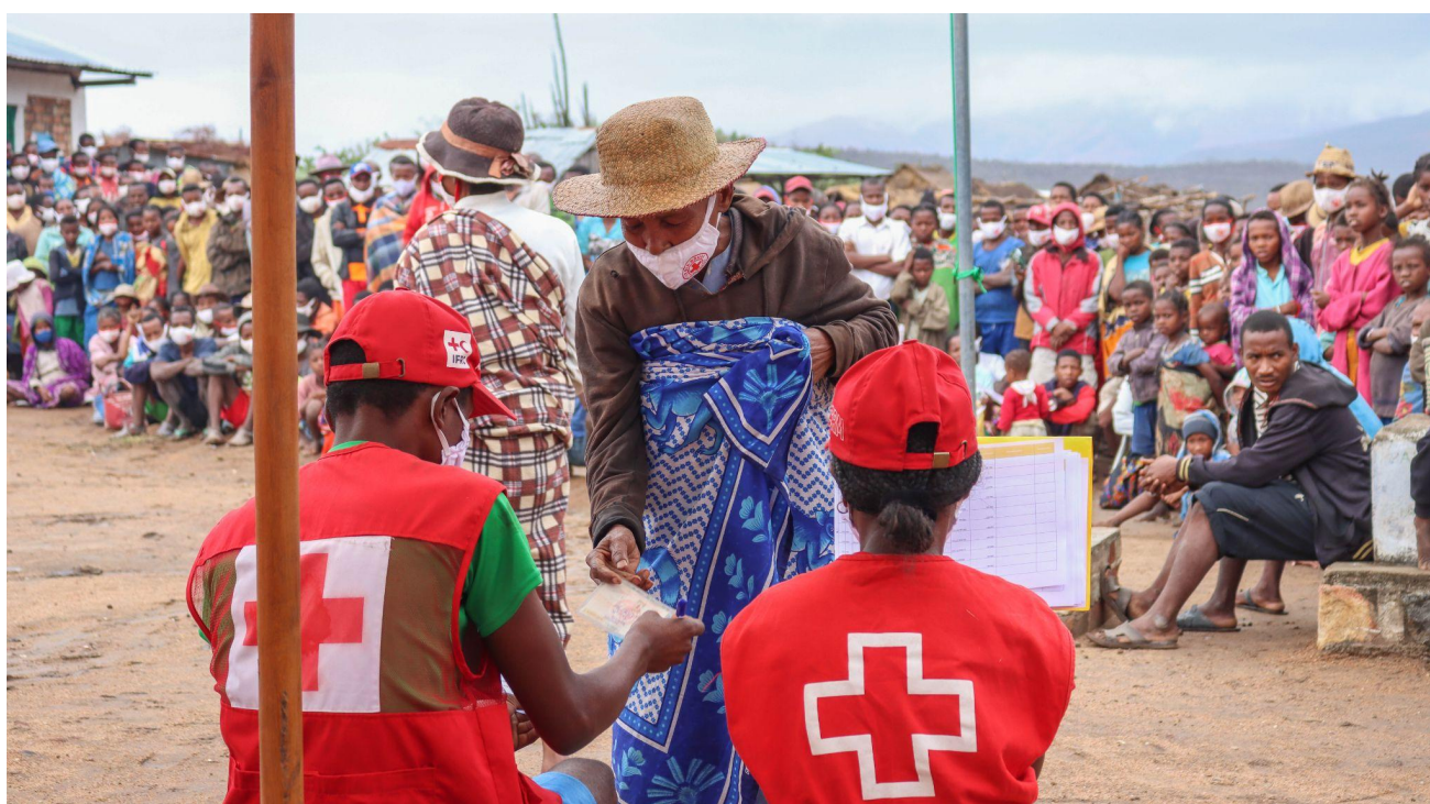
Ambatoabo, Madagascar, novembre 2021. Les communautés reçoivent l'argent mensuel dans le cadre de l'opération de transfert monétaire.

Bureau régional de la FICR, Afrique Décembre 2021